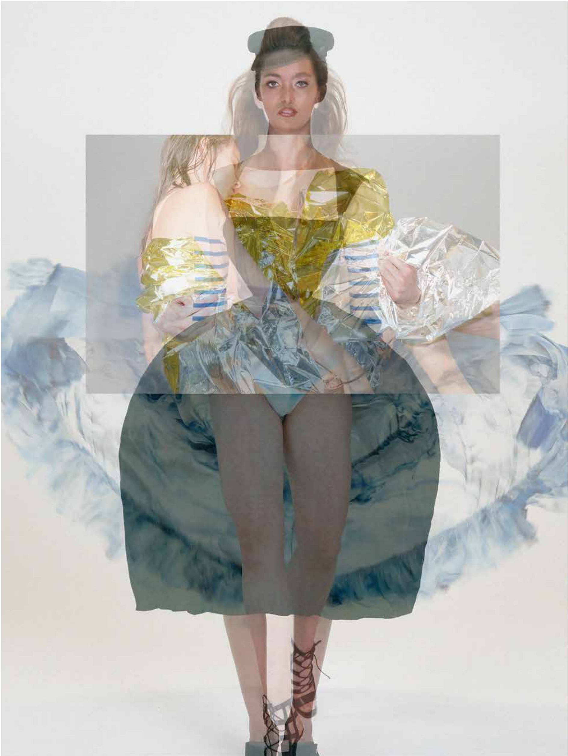
All is not lost - Koen Hauser - courtesy The Ravestijn Gallery / wardrobe styling: Xaviera Aubri, hair and make-up: Yokaw @ Angeliqve Hoorn Management / dresses: Jean Paul Gaultier / Roberto Cavalli / movement direction: Peter Leung (House of Makers/ Het Nationale Ballet)