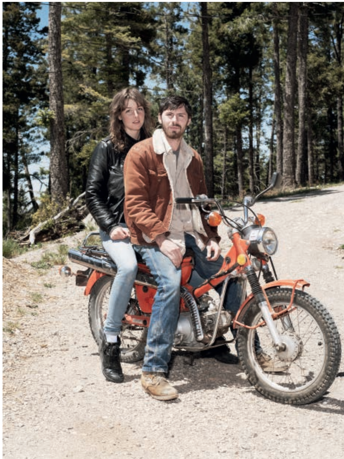
With Graden, ©Robin de Puy/Courtesy the Ravestijn Gallery

Om te ontdekken wat portretfotografie ook alweer is en wat haar persoonlijke drijfveren zijn, stapte ze vorig jaar op de motorfiets om drie maanden door Amerika te toeren. Zonder concreet plan, met als enige zekerheid dat elke ochtend de Harley Davidson op haar stond te wachten. Een camera plaatst alles in een kader. Raamstijlen in een auto doen dat ook. Op een motorfiets is elke omlijsting weg. Omringd door geuren en geluiden, overgeleverd aan zon, wind en regen met het wegdek vijftien centimeter onder je voeten heb je alle gelegenheid om de blik te verruimen. En, leerden wij van Loesje-van-de-posters: Een wijde blik verruimt het denken.