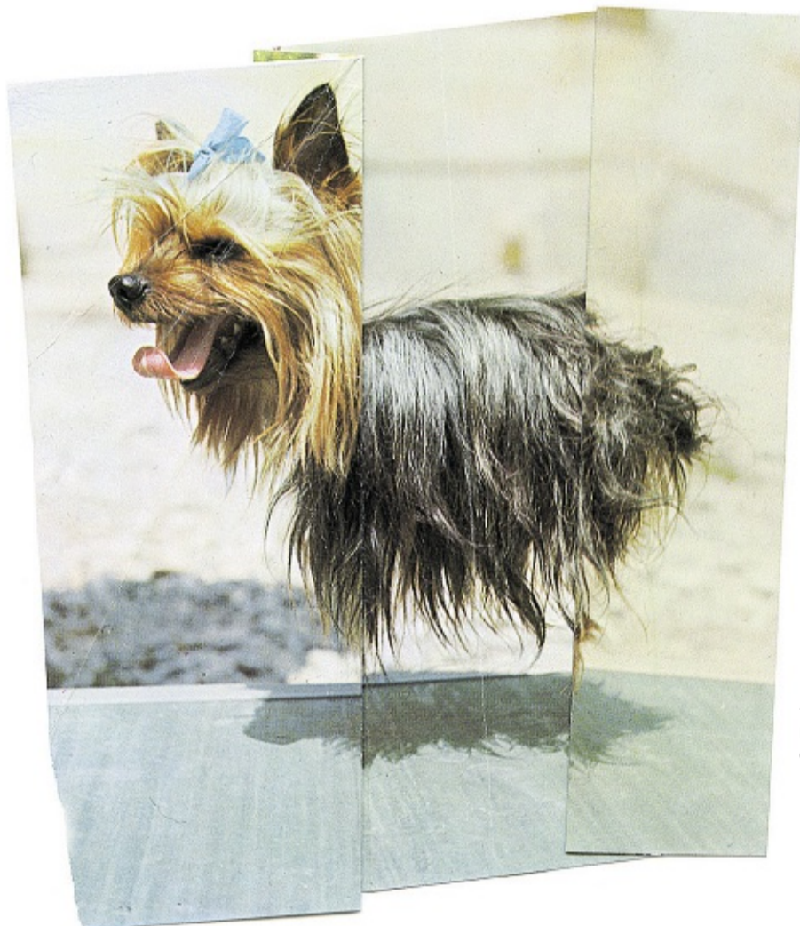
« The Levitators », RUTH VAN BEEK/COURTESY OF THE RAVESTIJN GALLERY