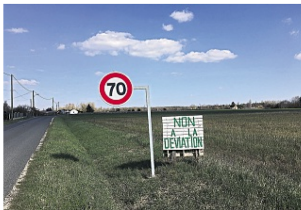
A Chémery, la déviation divisée. F.P.

Les opposants craignent une réaction en chaîne : le déclin de l'activité économique, la fermeture des écoles, bref « la mort du village ». Ils disent également redouter pour le bien-être de deux espèces protégées ayant leurs habitudes dans les champs promis au béton, une libellule (l'agrion de Mercure) et un oiseau limicole (l'œdicnème criard). L'installation de radars et de chicanes