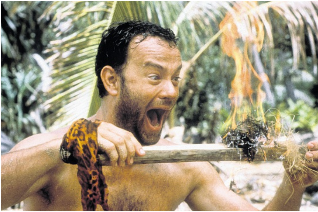
Tom Hanks est « Seul au monde » (Robert Zemeckis, 2000) et sans allumettes.