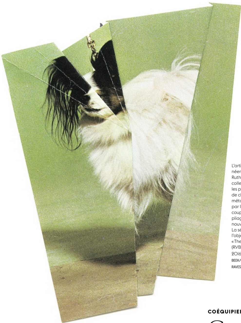
L'artiste néerlandaise Ruth van Beek collectionne les photos de chiens qu'elle métamorphose par le biais de coupages et de pliages, créant de nouvelles espèces. La série a fait l'objet d'un livre, « The Levitators » (RVB Books, 2016). RUTH VAN BEEK/COURTESY OF THE RAVESTIJN GALLERY