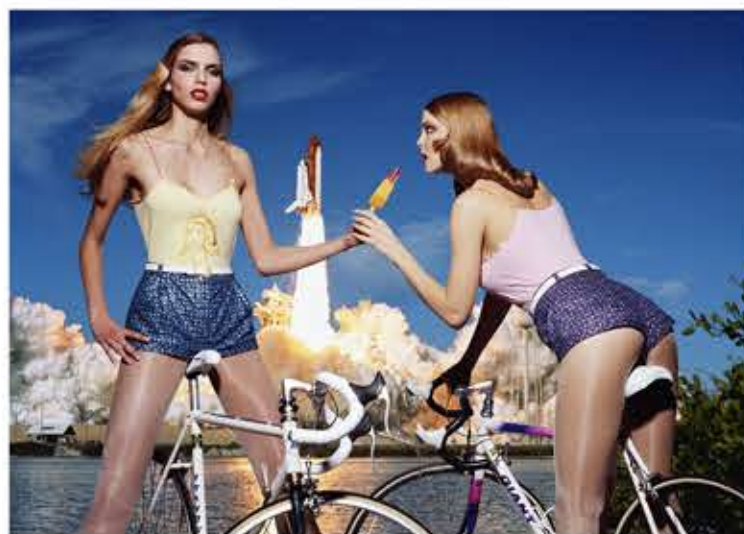
Raketeneis vor Raketenstart: aus einer Modestrecke von 1994